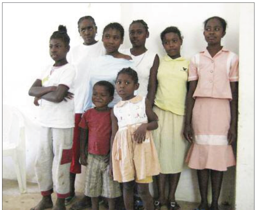
HÅPOM OPPLÆRING: Her er åtte av de døve barna som verdalingene kan hjelpe med skolegang, til et verdig liv og ut av isolasjonen.